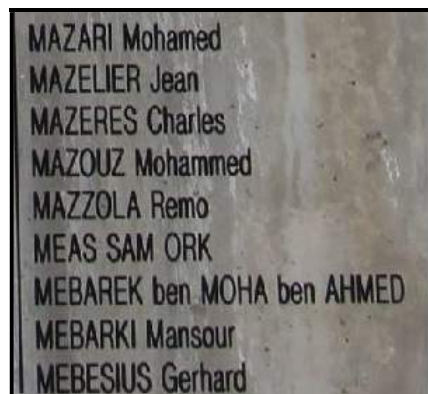
A gauche mémorial des guerres d'Indochine, à droite détail du Mur du Souvenir (Fréjus)